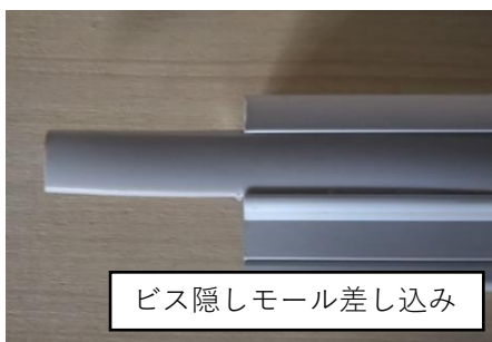
ビス隠しモール差し込み