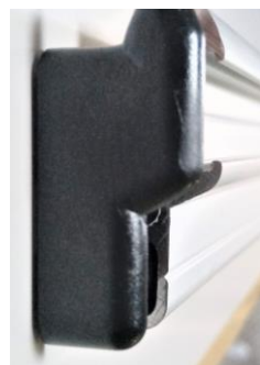
エンドキャップ差し込み